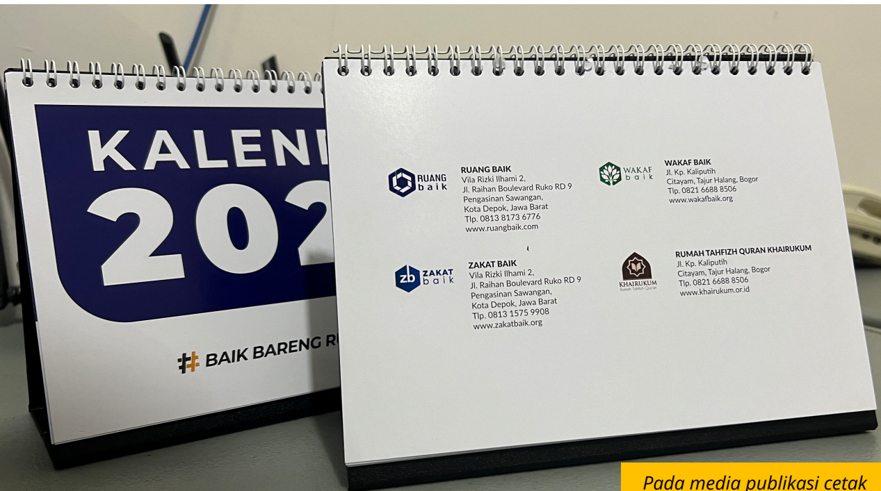
Pada media publikasi cetak