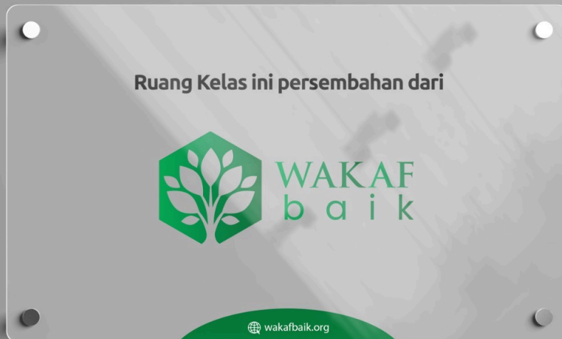
Pada Media Poster Kelas