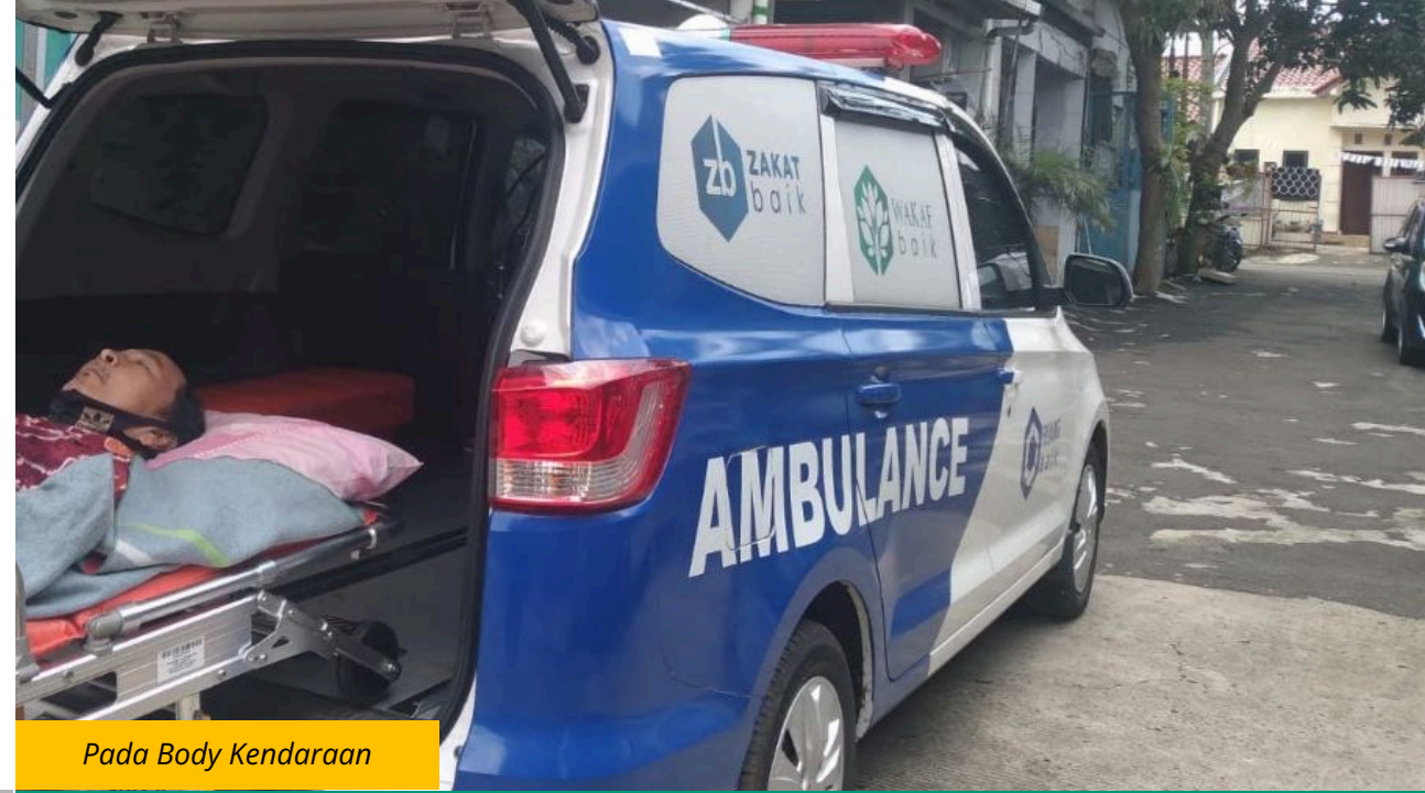
Pada Body Kendaraan